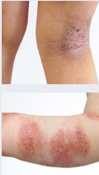
Abb. 4: Typische Manifestationsstellen der atopischen Dermatitis