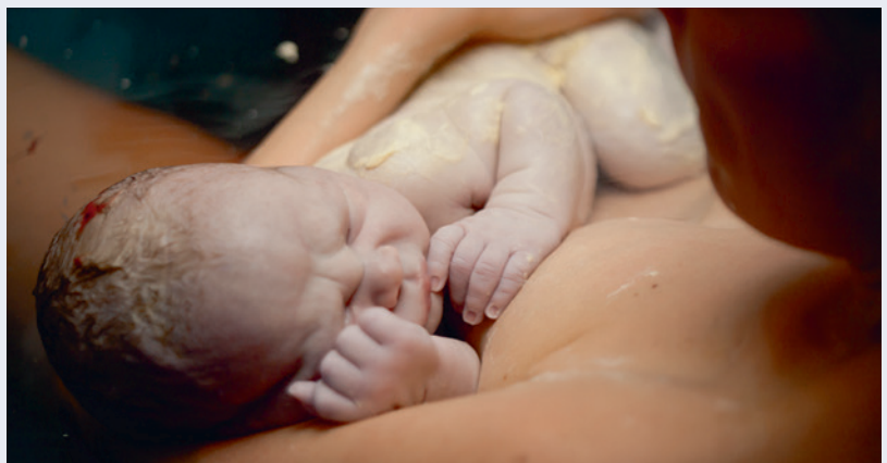
Abb. 2: Neugeborenes mit Käseschmiere

Während das Mikrobiom der Haut von Neugeborenen ein relativ homogenes Muster an allen Körperstellen aufweist, beobachtet man bereits nach sechs Wochen das typische Besiedlungsmuster der regionalen Hautzonen, unterschieden nach trockenen, fetten oder feuchten Arealen – analog zu Erwachsenen 8 . Bei Kaiserschnitt-Kindern überwiegen zunächst Stämme von Propionibacterium und Streptococcus , bei vaginaler Geburt hingegen Lactobacilli . Im Alter von sechs Wochen findet sich jedoch kein vom Geburtsmodus abhängiger Unterschied mehr 8 . „Interessant sind jedoch diese Unterschiede bis zur sechsten Woche, da hier möglicherweise ein entscheidendes ‚window of